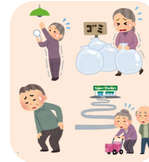
①生活のしづらさを解消する

リハビリ専門職と面談し、元の生活に戻るお手伝いをします。セルフマネジメント（自分で自分の調子を整える）能力を身につけ、利用者が元気になることを目指すサービスです。