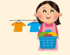
利用者の服などの洗濯