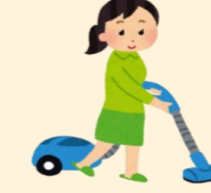
普段使っている部屋の掃除