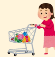
生活必需品の買い物