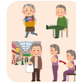
②セルフマネジメントが可能になり自信をもって生活ができるようになる