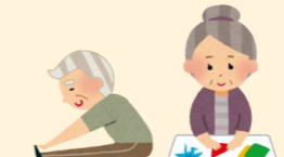
レクリエーションや体操など (機能訓練活動)