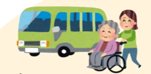
デイサービスに行きます