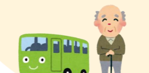
プログラムが終わったら帰ります