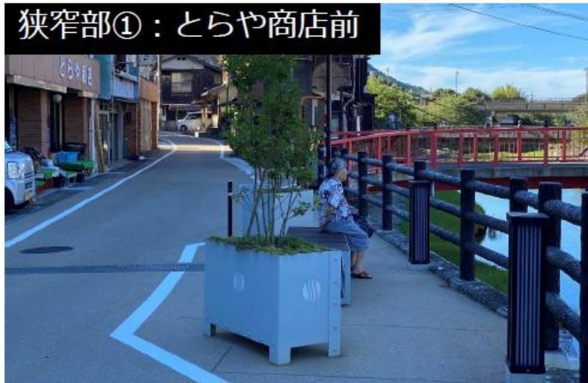
狭窄部①：とらや商店前