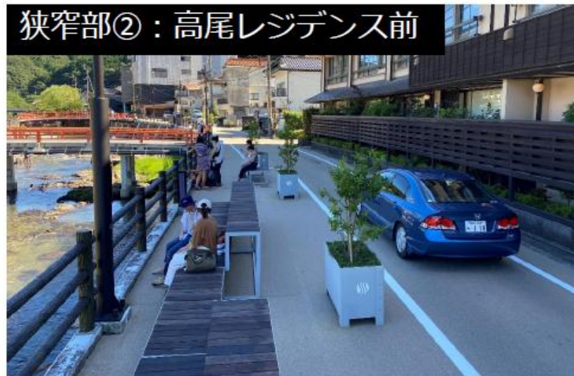
狭窄部②：高尾レジデンス前